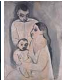
Picasso – Kunstmuseum Basel