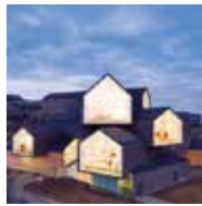
Schaudepot Vitra zu Vitra