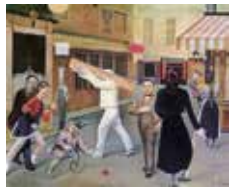
Balthus – Fondation Beyeler